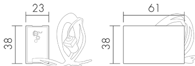
Abmessungen in mm