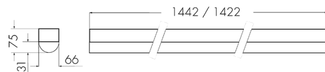
Abmessungen in mm