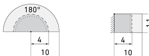
Dimensioni in m

a sinistra: vista dall'alto, a destra: vista laterale